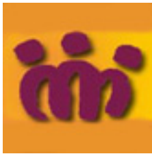
Asociación Minga [2]

víctimas del Estado y entabla denuncias internacionales.